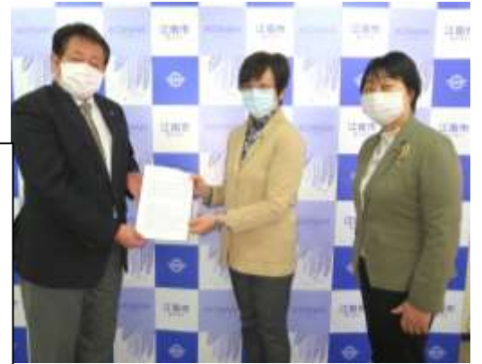
日本共産党議員団は4月10日、市長に対し、市民の暮らしと営業を守る緊急の申し入れを行いました。(上写真) 主な申し入れ項目は写真左、詳細は議員団HPを。