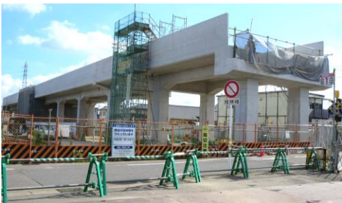
布袋駅周辺で進む高架化工事

6月議会に、新しい布袋駅舎へのエスカレーター設置工事費2億3千万円が提案され、江南市と名鉄との覚書(案)が示されました。