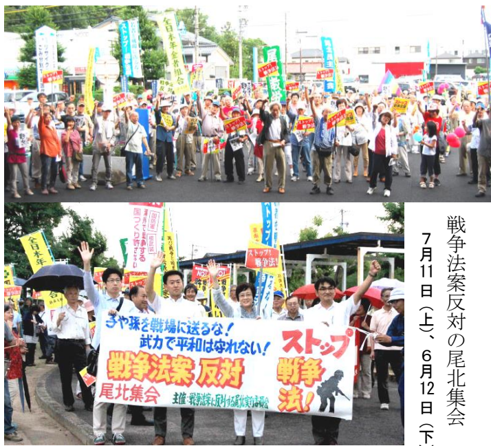
戦争法案反対の尾北集会 7月11日(土)、6月12日(下)

総務委員会で請願人5人は、「憲法9条は世界の宝。憲法違反の戦争法案は廃案に」と切々と意見陳述。しかし保守系議員らは、集団的自衛権とは無関係の砂川判決まで持ち出して「集団的自衛権は憲法違反ではない」「国会は95日間も延長して審議している。今はその動向を