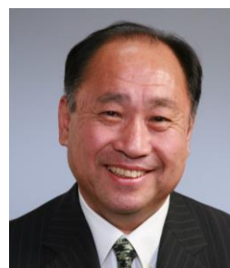
あすま 東よしき 義喜

こうした事態を開き直していくため、地域経済や雇用などを担っている中小企業の活性化につながる振興条例を制定することを要望しました。