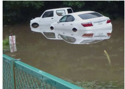
（H23.8.23の集中豪雨で冠水した車）

河野地域の浸水被害を解消するために、現在行われている大江川の工事に合わせ、用水の改修についても地元要望を聞き早急に計画を立て進めるよう提案しました。