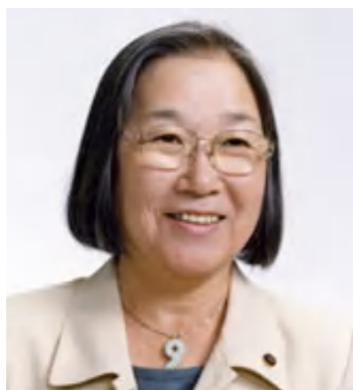
市議会議員 森ケイ子